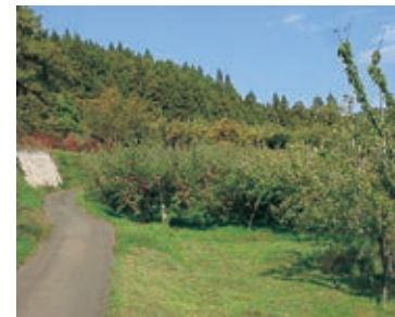
蝶ヶ森ふもとのリンゴ園